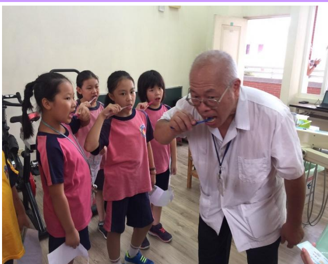
牙醫師認真示範給學生看如何正確潔牙並贈送學生牙刷牙膏。