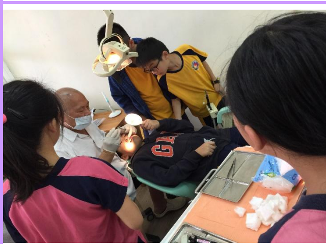
牙醫師為低學生施作窩溝封填、免費塗氟、牙菌斑清除與口腔保健衛教。