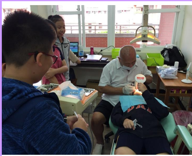
牙醫師教導學生如何檢查自己牙齒刷乾淨了嗎？