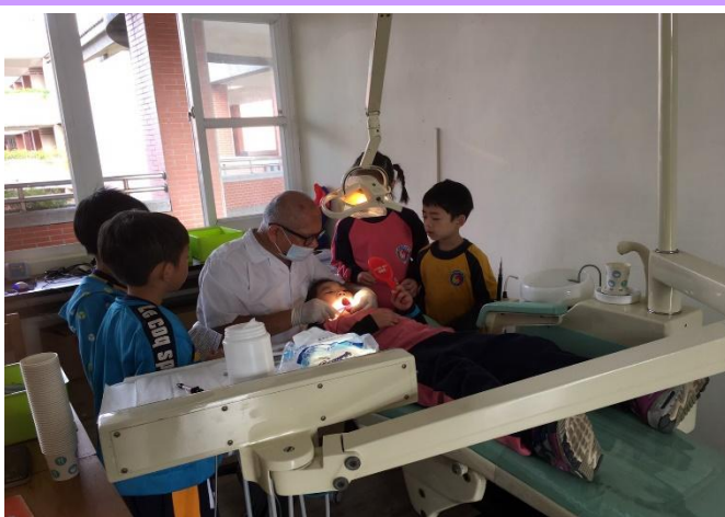
牙醫師為學生做口腔保健牙菌斑清除與免費塗氟，共同照顧學童牙齒。